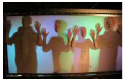
PMHG-ler in Aktion (Fa)